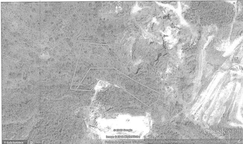
Bloques contiguos que conforman el polígono objeto de estudio.